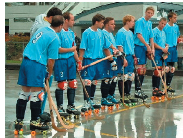
Photo: l'équipe première.

La jeunesse de cette équipe, qui a pu constituer un petit handicap lors de ce tour préliminaire, est en fait une chance énorme et une source d'espoir pour la suite. Ces jeunes, qui